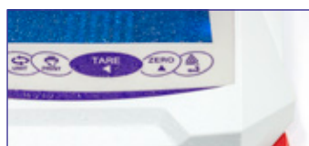
Tastiera a tenuta di spruzzi