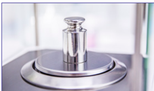
Fornita con Massa campione in classe di precisione E2, per la taratura e la verifica