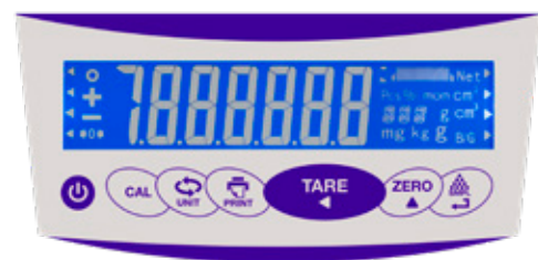
Tastiera e display