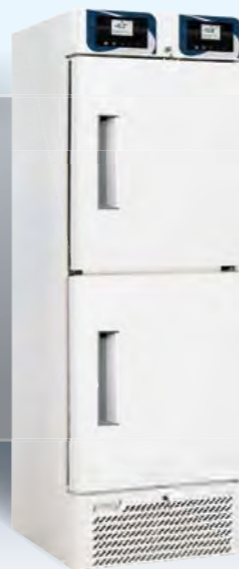
LCRR 370 - 530