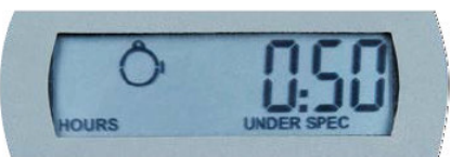
Periodo fuori specifica della sonda esterna