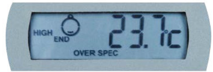
Valore max di temperatura fuori specifica