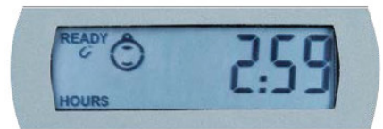
Partenza ritardata tramite magnete