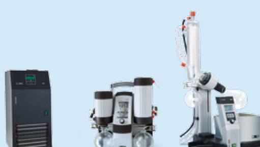
C 900 SC 920 RC 600