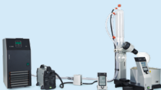
C 900 N 920 G VC 900 RC 600